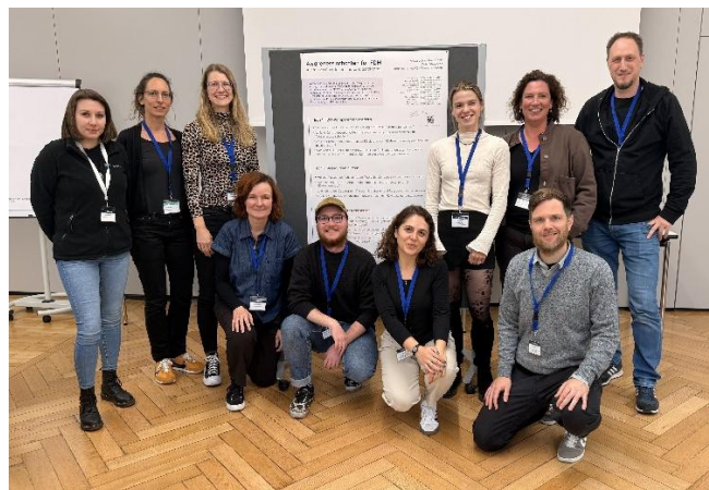
FDM@Campus 2025, Göttingen

Die Ergebnisse des World Cafés werden in Kürze auf Zenodo veröffentlicht. Wir freuen uns bereits auf die Fortsetzung im November bei den Data Days Niedersachsen in Braunschweig.