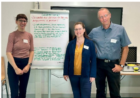
HdN Summit, 2025 Hannover

Die HdN ist ein Zusammenschluss der 20 staatlichen Hochschulen in Niedersachsen. Ziel ist die Förderung der digitalen Transformation an allen Hochschulstandorten durch die Entwicklung hochschulübergreifender IT-Konzepte und Services. Damit werden Ressourcen effizient genutzt und innovative Projekte in Lehre, Forschung und Verwaltung unterstützt. Weitere Informationen zur HdN finden Sie hier .